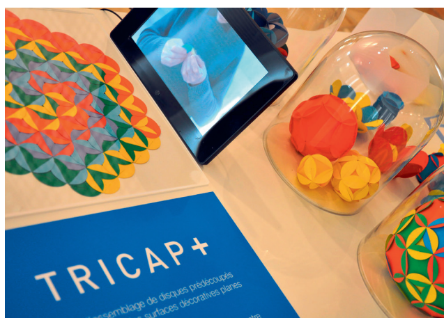
Géométrie par le jeu

Tarif C / Réservation obligatoire sur la billetterie en ligne billetweb.fr ou en vente directe au palais du Roi de Rome ou à l'Office de tourisme Rambouillet Territoires, aux horaires d'ouverture.