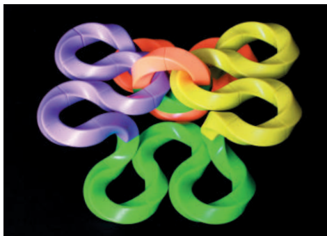
C-CUB / Fabien Vienne

La présence d'un adulte accompagnateur est obligatoire.