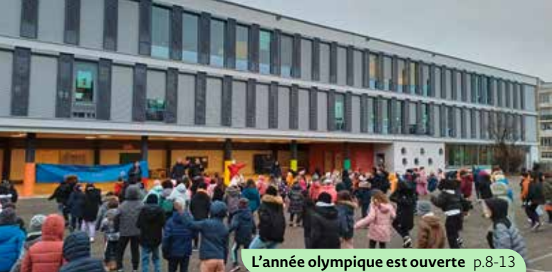
L'année olympique est ouverte p.8-13