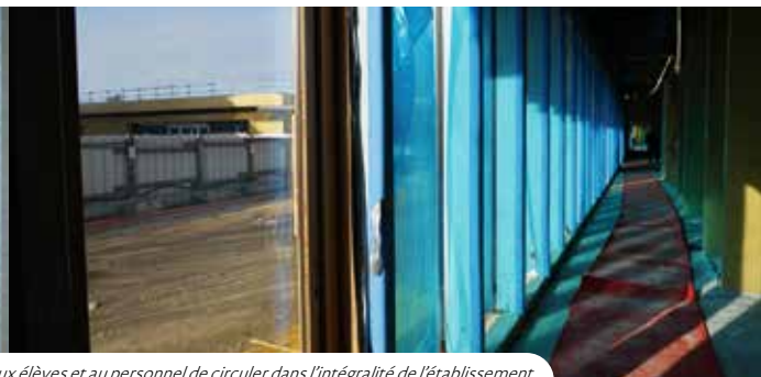
Couloir principal du CLAE, qui sera entièrement vitré, permettra aux élèves et au personnel de circuler dans l'intégralité de l'établissement.