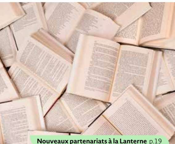
Nouveaux partenariats à la Lanterne p.19