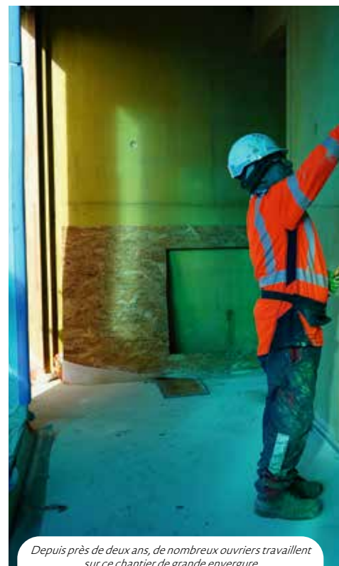
Depuis près de deux ans, de nombreux ouvriers travaillent sur ce chantier de grande envergure