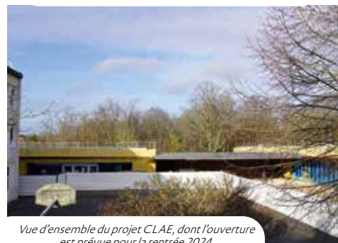
Vue d'ensemble du projet CLAE, dont l'ouverture est prévue pour la rentrée 2024.