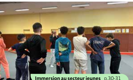
Immersion au secteur jeunes p.30-31

Directrice de la publication : Véronique Matillon • Directrice de la communication : Adeline Hébert • Rédaction : Melinda Correia • Maquette & réalisation : Florian Poulain • Impression (sur papier recyclé, pelliculage de la couverture écoresponsable) : imprimerie RAS • Rambouillet Infos est disponible pour les non-voyants : Bibliothèque sonore 01 34 83 13 60 - 78@advbs.fr - www.bs-rambouillet.fr