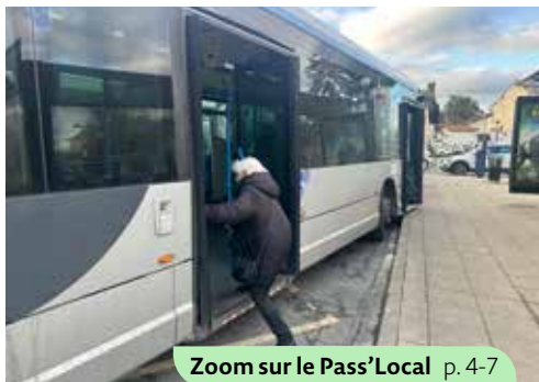
Zoom sur le Pass'Local p. 4-7