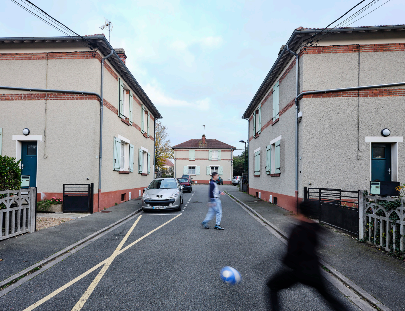
Cité-jardins des Éveuses