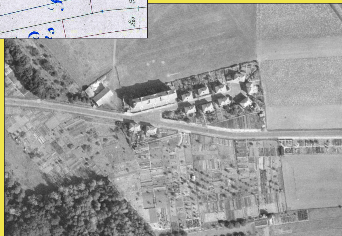
2. Photographie aérienne de 1947